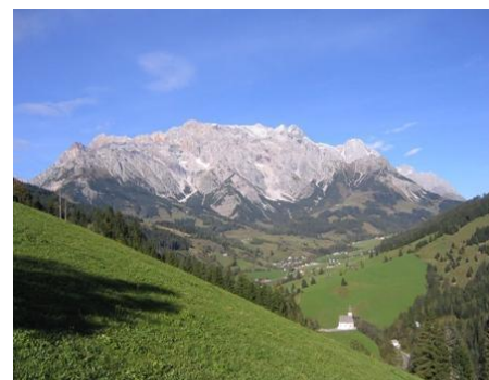
Blick auf das Hochkönig Bergmassiv