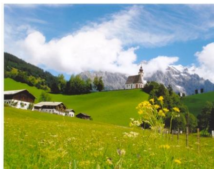
Blick auf die Dientner Bergkirche