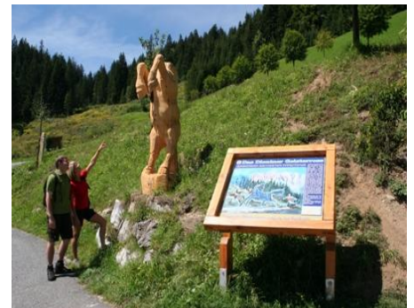
Das Geisterross aus Dienten