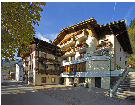
Ausgangspunkt Vital-Hotel Post

Vom Vital Hotel Post zum Pfarrhof weiter auf den Weg Nr. 440 etwas steilerer Anstieg zur Kirche ( 1505 ) und weiter bis zur Abzweigung Dorfpanoramaweg. Den Weg Nr. 53a folgend bis zum Wasserfall und weiter bis zum Almhäusel mit 3 Abzweigungsmöglichkeiten in das Ortszentrum. Gehzeit 30-40 Min bis zum Almhäusel (Einkehrmöglichkeit). Es geht zurück in den Ortsanfang und über die verkehrsberuhigte Straße "Reizegg" Nr. 65 steil hoch Richtung Zachhofbauer ( einer der ältesten Erbhöfe) kurz vor dem Hof biegt man rechts ab Richtung Bründlstadt Nr. 65 a. Nur leicht steigend umwandert man nun Dienten von der anderen Seite bis zum Tal-Weg Nr. 15. Gehzeit vom Almhäusel bis zum Hotel ca. 35 Minuten.