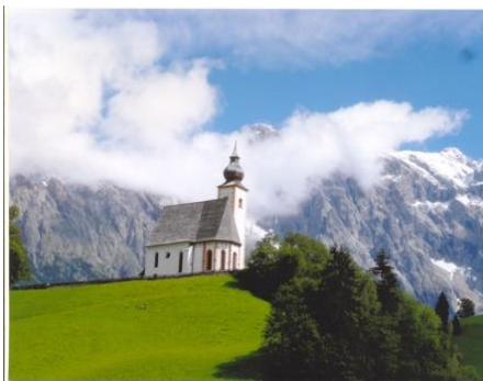
Blick zur Bergkirche von Dienten